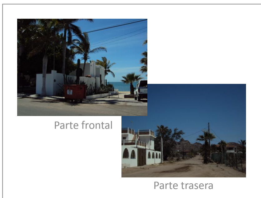
Imagen 3. Kino Nuevo, parte frontal y parte trasera.

Kino es un lugar de dualidades como es común en todas las playas de la república mexicana. Hay una parte frontal, maquillada para turistas y una parte trasera que pertenece a los nativos del lugar que lo hacen funcionar. En nuestro recorrido nos avocamos a apreciar la parte frontal de Kino Nuevo. Nuestra interpretación es solo una entre muchas posibles lecturas. Al entrar a la avenida Mar de Cortés y no ver los grandes hoteles que caracterizan otros sitios vacacionales, se advierte una vocación distinta del lugar, como destino turístico regional. Se siente como una comunidad tranquila, las casas son limpias y sin graffiti, inspirando una seguridad que es reafirmada por la presencia de policías. Quienes habitan este lugar son personas mayores, retirados, que a juzgar por las antenas de televisión satelital pueden llevar una vida confortable en un sitio como este. A pesar de la falta de áreas verdes, se puede sentir un contacto cercano con la naturaleza, por ejemplo, al estar en contacto con las gaviotas en la playa.