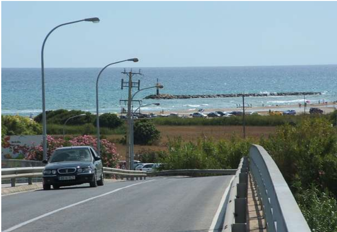
Figura 1. Altafulla, en la costa catalana (Tarragona). Puentes para salvar la frontera que el ferrocarril impuso en el territorio litoral desde el siglo XIX y que desde mediados del XX hasta la actualidad no ha cesado de ser impactado por nuevas ocupaciones de suelo.

Los territorios turísticos de la costa mediterránea se encuentran entre los ámbitos geográficos que más han aumentado su superficie urbanizada, incluyéndose entre las áreas urbanas de España de mayores crecimientos relativos entre 1981 y 2006.