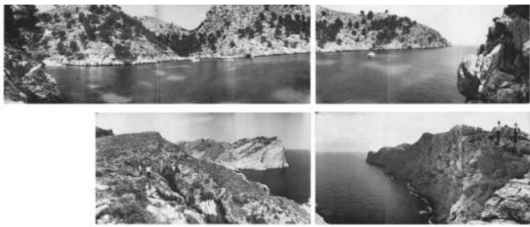
Figura 4. Mallorca. El orden territorial coetáneo a la irrupción del turismo. Colección Rutas escondidas (Freixa 2007).