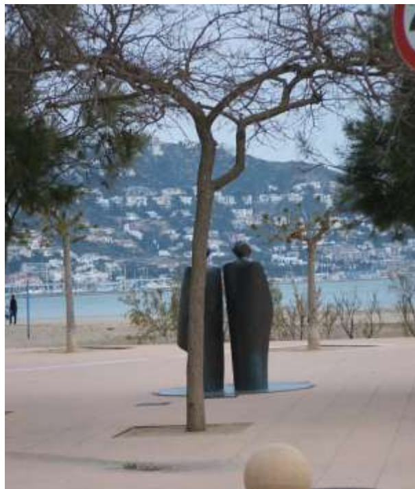
Figura 15. Roses. El proyecto de ciudad combina una acción pública por mejorar el espacio público al tiempo que asume –como declara un responsable político del Ayuntamiento de Roses- la evidencia de un proyecto de territorio en progresiva urbanización: “el Plan Director Costero catalán no ha afectado a Roses, porque ha afectado solo a lo que era suelo no urbanizable. Por desgracia no