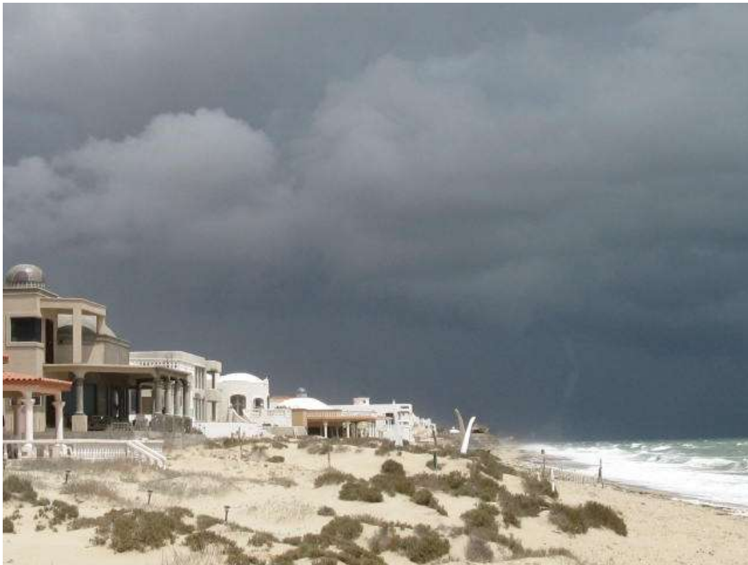
Figura 11. Puerto Peñasco. Sonora.

Especialmente interesante, de cara a la reflexión sobre el caso local son los paralelismos entre las raíces y las formas de desarrollo del modelo balear con la actual presión turística en costas mexicanas. Las inversiones españolas, al igual que sucedió en las Baleares, son fuertemente criticadas por su depredación ambiental, efectuada al amparo de los gobiernos, con modificaciones legales a modo, la corrupción de funcionarios y la polarización social. La experiencia del caso balear según el balance de ambos expertos: “el desarrollo turístico de México se inscribe en la política de ‘acoplamiento’ con Estados Unidos del presidente Fox. Megaproyectos como los de Cancún, Acapulco 52 o la Costa Maya están generando auténticas conurbaciones turísticas