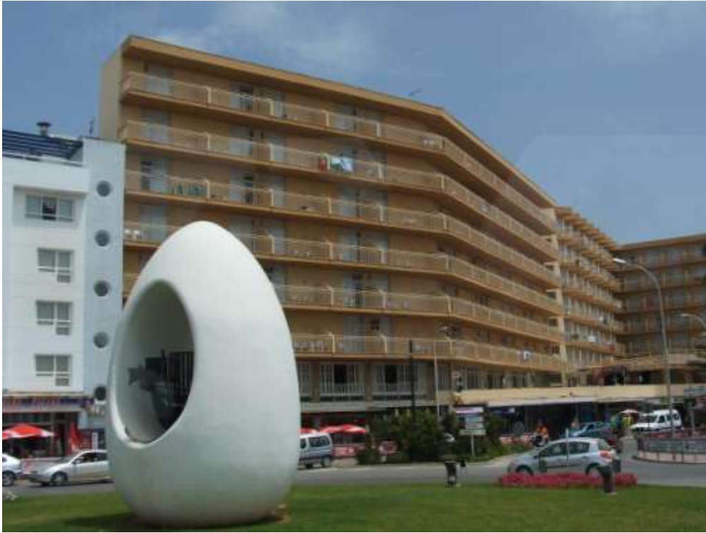
Figura 9. Costa ibicenca. Baleares, España.