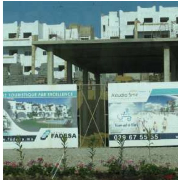
Figura 7. El capital inmobiliario español conquista el norte de Marruecos 36 . 2008