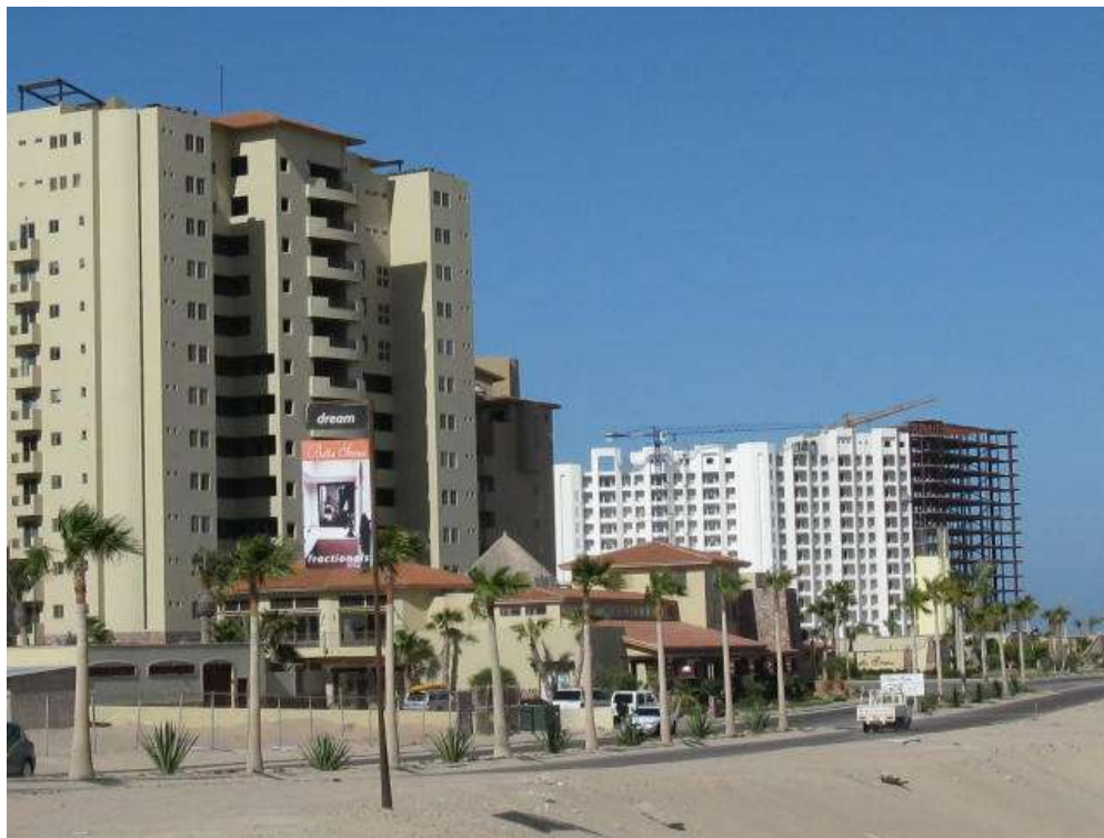
Figura 10. Puerto Peñasco. Sonora, México.