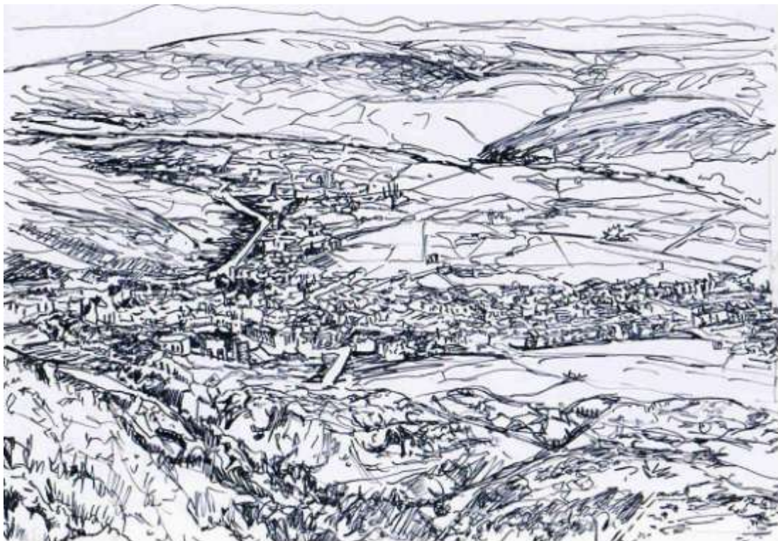
Figura 8. Menorca desde el Toro, Islas Baleares, 2006. La domesticación del orden natural por el rural aún contiene la presión de lo urbano. Dibujo de la autora a partir de fotografía de CD VIII Coloquio de Geografía Urbana, 2007.