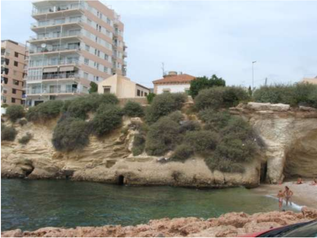
Figura 11. Ibiza. Baleares.