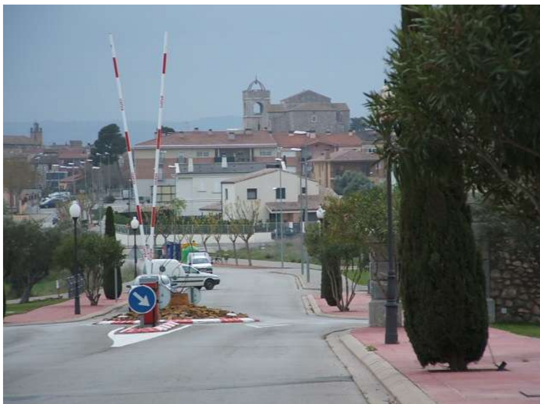
Figura 13. En Altavulla (Tarragona) la dispersión de usos urbanos en la franja interior determina una nueva ordenación del territorio y la difusión de las nuevas tendencias urbanas bajo modelos más privatizados y cerrados –Golf de Peralada (Ampurdán, Girona).