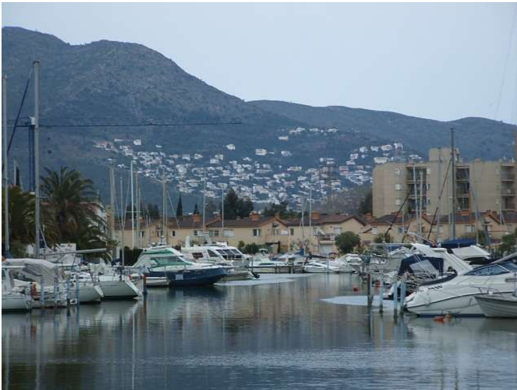
Figura 14. Roses. La urbanización se apodera de los aiguamolls para puerto deportivo (Santa Margarida) y urbaniza con vivienda unifamiliar dispersa la ladera del Pirineo oriental.