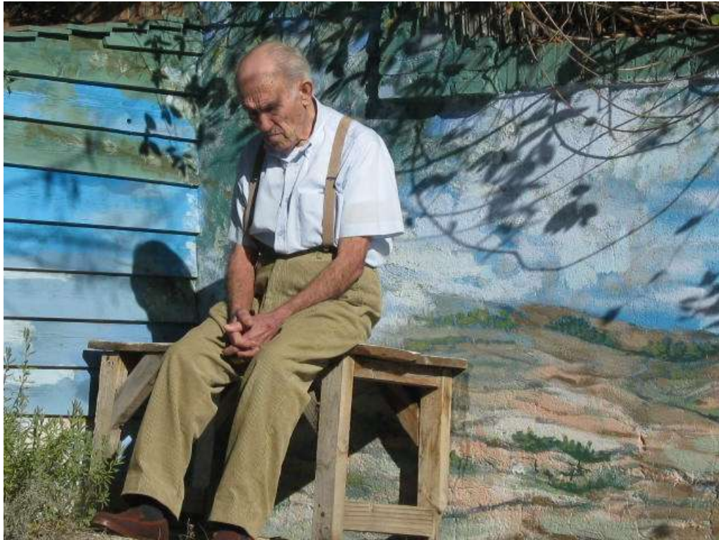
Figura 5. Medio siglo después, los campos son de ficción, nuevos grafittis en los muros de la ciudad socioagorafóbica 27 y las gentes ya no tienen que labrar. Composición fotográfica de I. Rodríguez sobre sus paisajes murales de campos yermos.