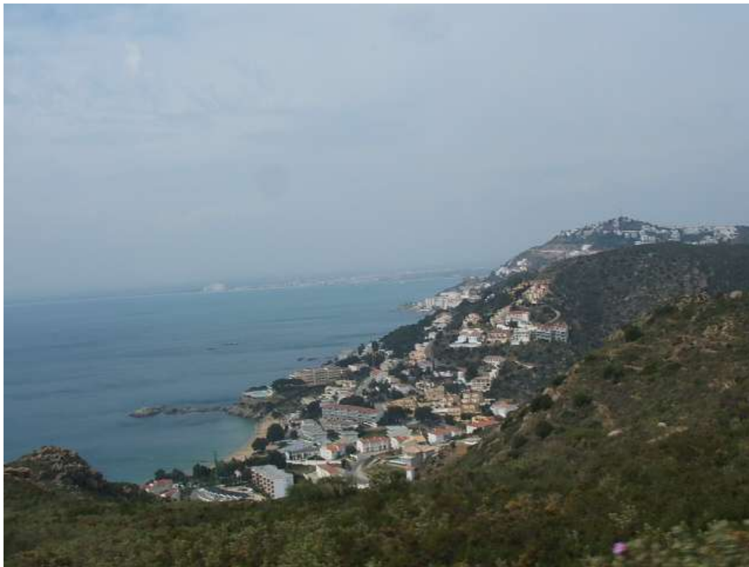
Figura 12. Costa catalana sigue urbanizando el litoral independientemente de su naturaleza como en Tamarit (Tarragona) y el la Península del Cabo de Creus, en Roses (Girona).