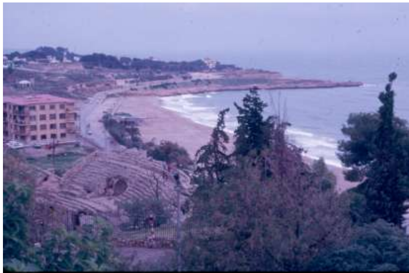
Figura 3. Tarragona. La ocupación de nuevos usos sobre la playa desde tiempos romanos se multiplica en los últimos años cómo se observa en la imagen izquierda (2006) respecto de la derecha (1996).

a pedazos como las etapas y partes de un proceso de continuo avance a partir de las nuevas vías que son también barreras para otras circulaciones que necesitan ser medidas