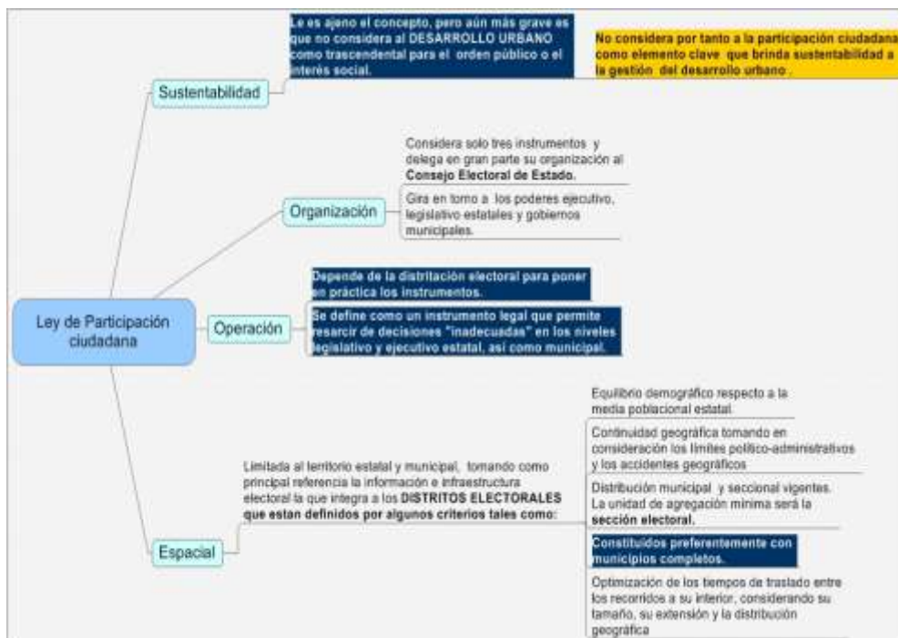
Diagrama 3. Limitaciones de la Ley de Participación Ciudadana para el Estado de Jalisco respecto al Desarrollo Urbano.

Basado en los alcances y limitaciones anteriormente expuestos podemos aproximar las siguientes reflexiones del instrumento legal. Desde la perspectiva de la sustentabilidad al serle ajeno el concepto en sí mismo, genera ambigüedad respecto que valores rigen al interés público y orden social, y más aún como se instrumenta o hasta dónde puede llegar a instrumentarse, pero aún más grave es que no considera al desarrollo urbano trascendental para el orden público o el interés social.