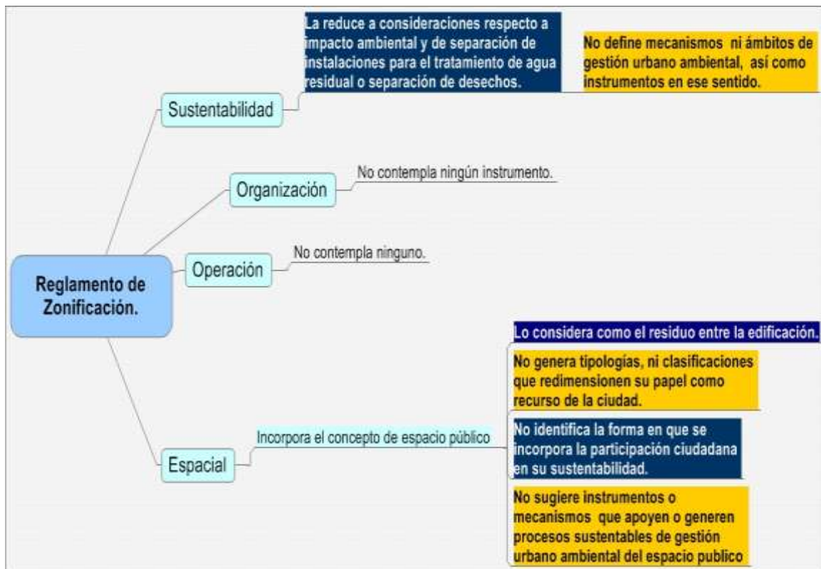
Diagrama 2. Limitaciones del Reglamento de Zonificación del Estado de Jalisco respecto a la participación ciudadana y el espacio público.

Esta visión reduccionista no permite redimensionar la importancia del espacio público, no solo en su dimensión desde la configuración urbana, la cual de por sí ya es limitada, no solo por lo previsto en el presente instrumento reglamentario, sino que se reduce su importancia como facilitador de la vida pública que finalmente propicia la formación y/o consolidación de la ciudadanía. Dicha importancia puede dar como resultado en la norma de diseño cuando menos a una tipología y criterios de aplicación mínimos en el espacio público, de acuerdo a su importancia como facilitador y detonante de la vida pública.