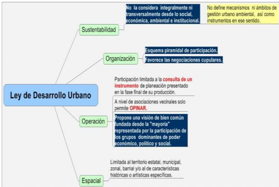
Diagrama 1. Limitantes de la Ley de Desarrollo Urbano del Estado de Jalisco en términos de participación ciudadana y espacio público.

Respecto a los planes parciales de desarrollo urbano y de urbanización , que se contemplan dentro de esta Ley, podemos mencionar que no es un instrumento generalizado en la práctica, que se aplique en la totalidad de un Centro de Población, y solo es requisito indispensable para los nuevos desarrollos en ciertas zonas, que por sus características concretas e intereses en juego lo requieren. Es interesante destacar que al no existir un sistema claro, transparente, público y accesible de indicadores y criterios de desarrollo urbano por unidad territorial, la correspondencia entre lo dispuesto por el Programa Municipal de desarrollo urbano, el Plan de Centro de Población y el Plan Parcial es motivo de interpretación subjetiva y en algunos casos, se omite lo establecido en ellos.