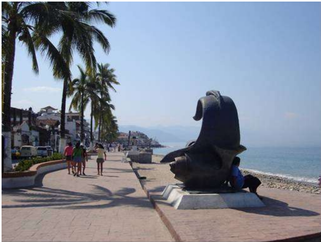
Imagen 2. Vista del Malecón de Puerto Vallarta, el espacio público más representativo de la ciudad de acuerdo con las encuestas aplicadas en este estudio.

Para lograr un primer acercamiento al tema, se diseñó y aplicó una entrevista a residentes de Puerto Vallarta, lo que nos permitió conocer algunas tendencias en la percepción ciudadana en relación a la zona conocida como “El Malecón.