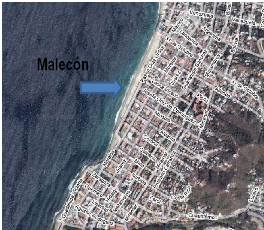
Imagen 1. Acercamiento satelital de la zona conocida como el Malecón de la ciudad de Puerto Vallarta.

La incorporación de mecanismos eficientes de participación ciudadana, contribuyen en gran medida a consolidar el poder democrático (PUND 2004,175) de nuestras sociedades latinoamericanas, ya que permite establecer las necesidades y criterios desde la práctica de la ciudadanía. En este sentido, la política tiene un papel fundamental, ya que teóricamente, es la que encarna las opciones, agrupa las voluntades y crea poder, aunque no es el único actor, ya que en las últimas décadas, la sociedad civil ha tenido una creciente participación a través de organizaciones que promueven esta participación, en favor de la expansión de la ciudadanía y de la democracia. Acciones, que frecuentemente se contraponen a la existencia de poderes fácticos, que