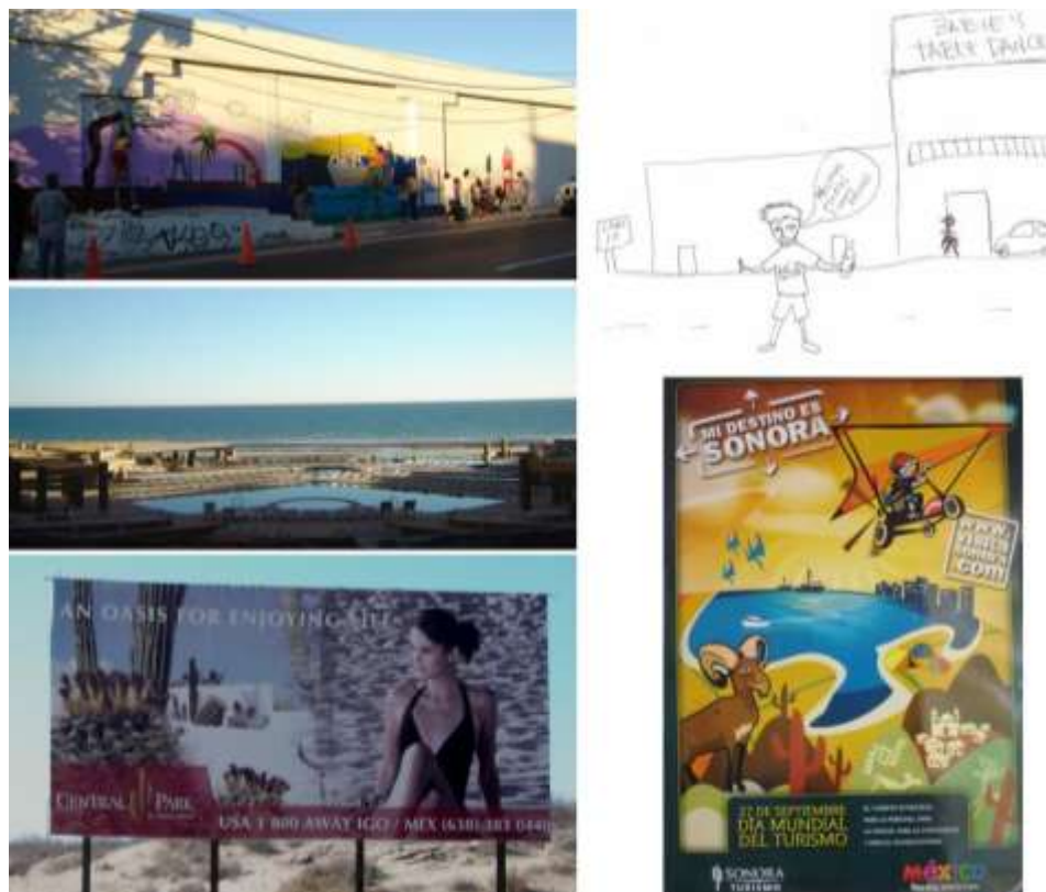
Figura 1a-d. Imaginarios visuales, imaginarios de creación. 1a. Arriba a la izquierda: Pintura infantil sobre muro en Puerto Peñasco, donde se aprecian el mar, el sol, la luna y las estrellas, un barco pesquero, el Cerro de la Ballena, así como algunas “palmeras plataneras”. 1b. Centro a la izquierda: Uno de los tipos de diseño hotelero más socorrido es aquél en cuyo centro se ubican las áreas de alberca franqueadas por las torres de condominios. 1c. Abajo a la izquierda: Anuncio espectacular publicitario que nos muestra dos imágenes superpuestas del desierto y de una joven sobre la arena. Para Marc Augé (2002, 108), estos cuerpos esbeltos, más que deseables, son cuerpos expresivos que denotan estados del alma, actitudes y miradas insinuantes. 1d. Arriba a la derecha: La “imagen más representativa” de Puerto Peñasco dibujada por un joven de 20 años, residente de Puerto Peñasco. 1d. Cartel publicitario “Mi destino Sonora”, cuya imagen muestra de manera predominante el desierto y Sandy Beach, emplazamiento de la mayoría de los hoteles en Puerto Peñasco.

El turismo es una forma particular de uso del tiempo libre que implica realizar una actividad des-rutinizadora. El origen etimológico de la palabra se desprende del galicismo del término francés tour , que quiere decir “viaje circular”, o “de vuelta al punto de partida”, utilizado por primera vez en 1670. Aunque